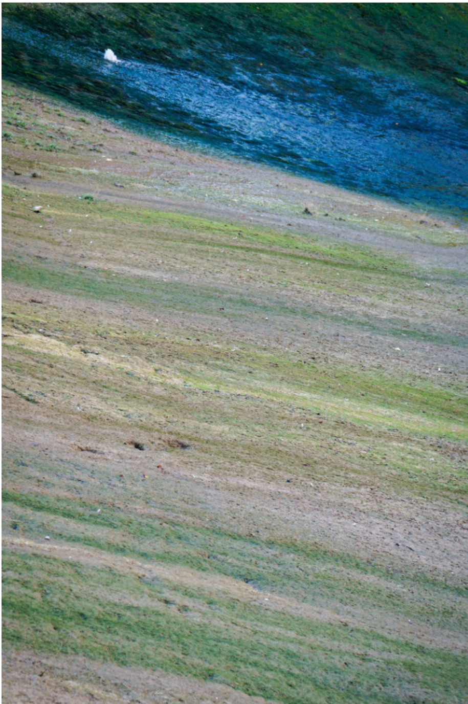
Überlauf des Kraftwerkes im Fluss Júcar