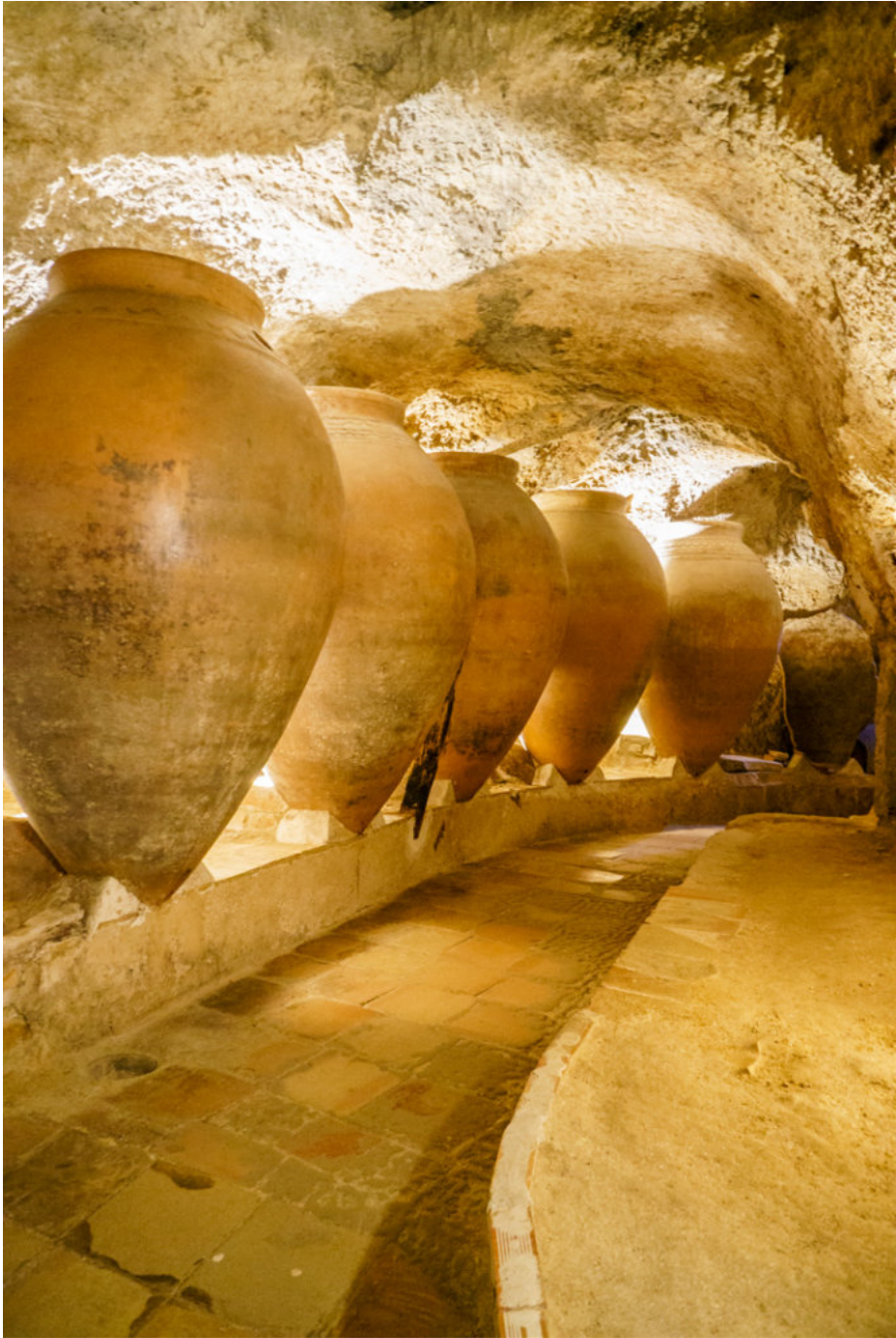
Weinmuseum Coves de la Villa in Requena