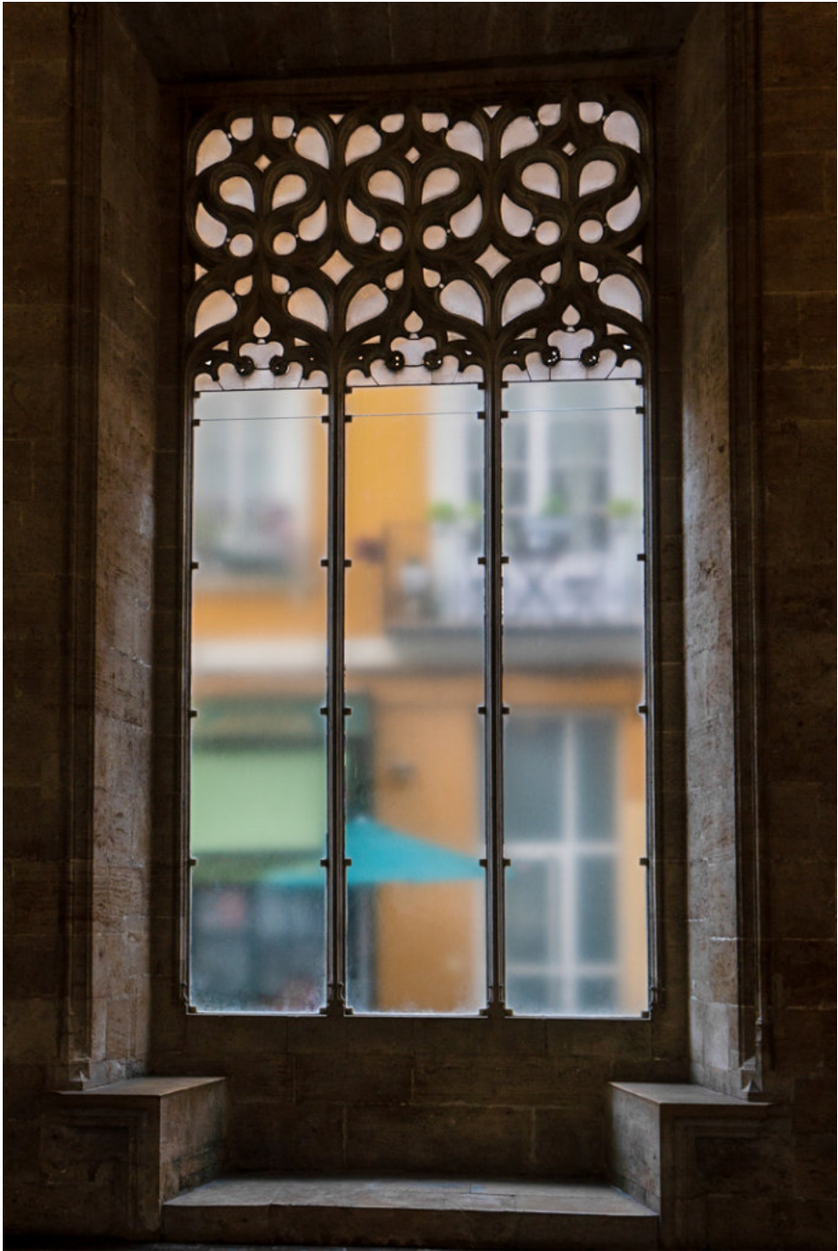
Im Seidenmarkt (Lonja)