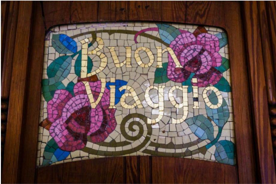
Im Bahnhof im Stil des Modernismo