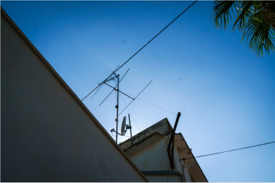
Stopp auf der Fahrt nach Valencia