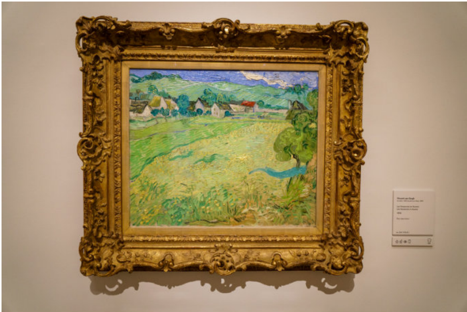
Van Gogh im Museo Thyssen-Bornemisza