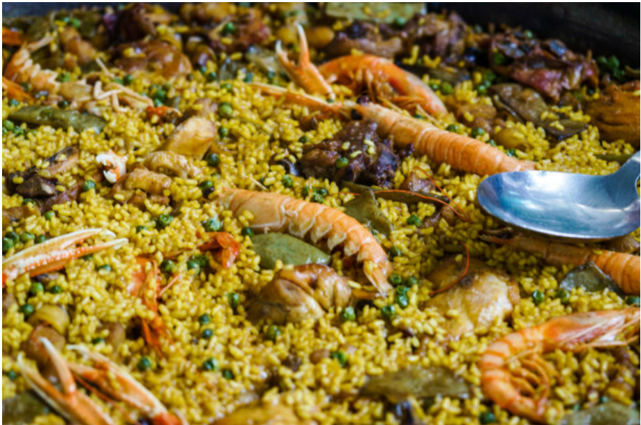
Ein kulinarischer Höhepunkt: Die Paella