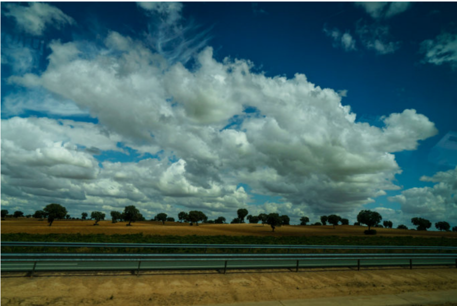
Fahrt nach El Toboso