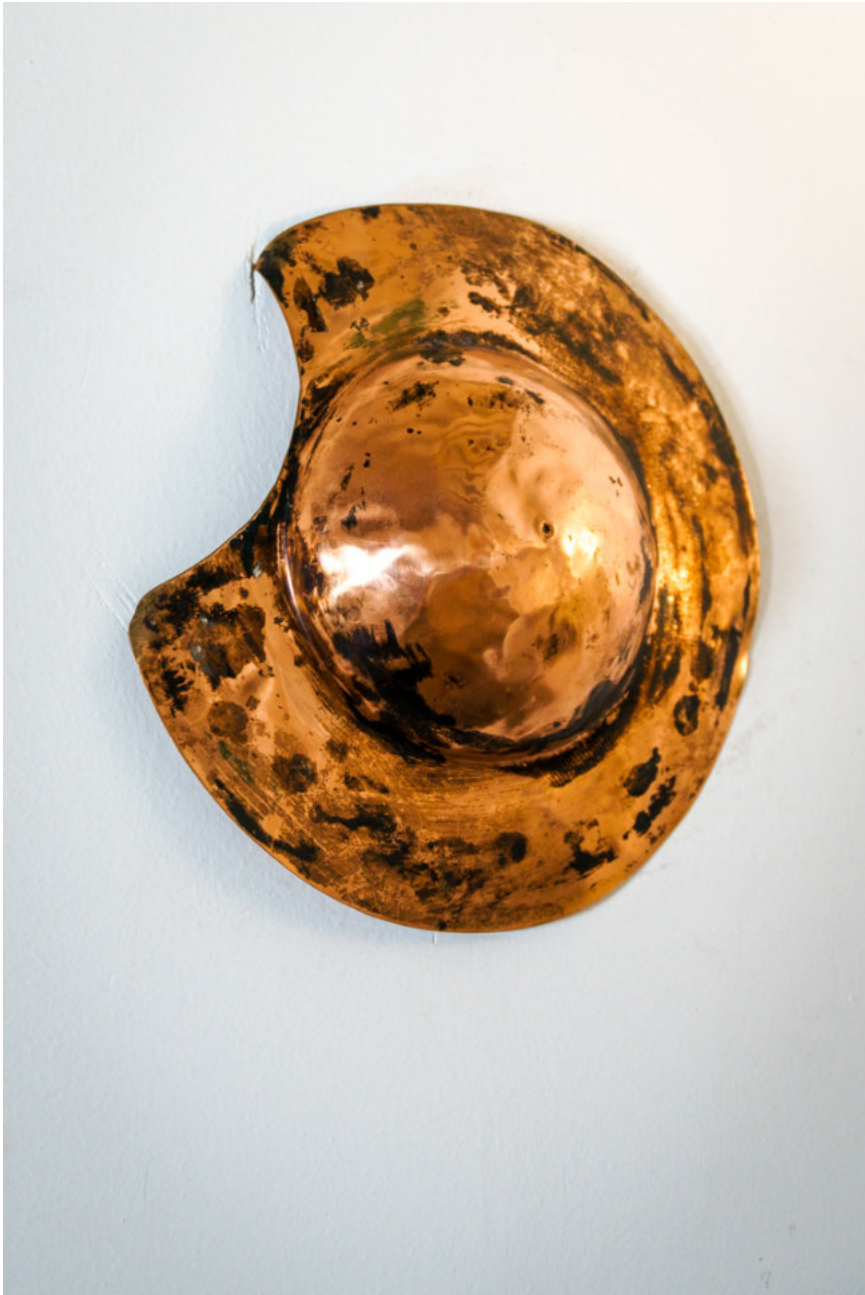
So könnte der Multifunktionshut von Don Quijote, dem Ritter von der traurigen Gestalt, ausgesehen haben...