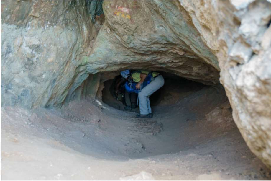
Durch diesen Tunnel trieben dazumal die Schäfer ihre Ziegen und Schafe diesen Tunnel