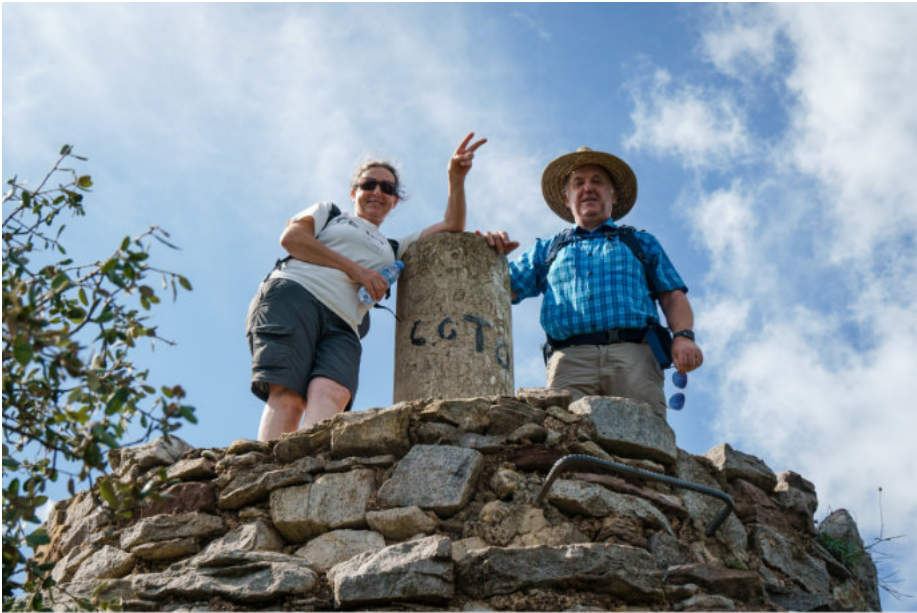
Auf dem Pico de Espadán