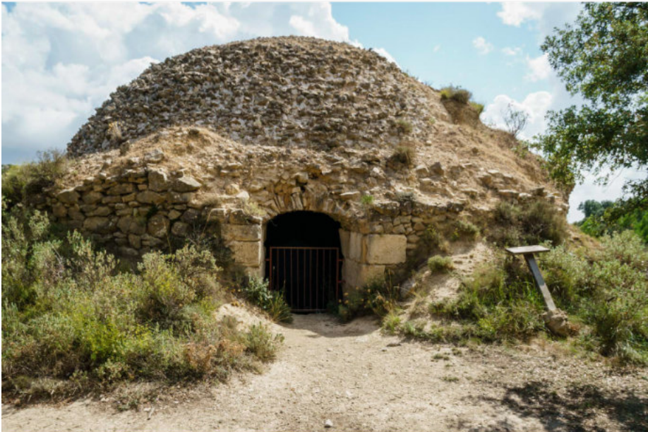
Schneebrunnen El Pou de Neu del Rentonar