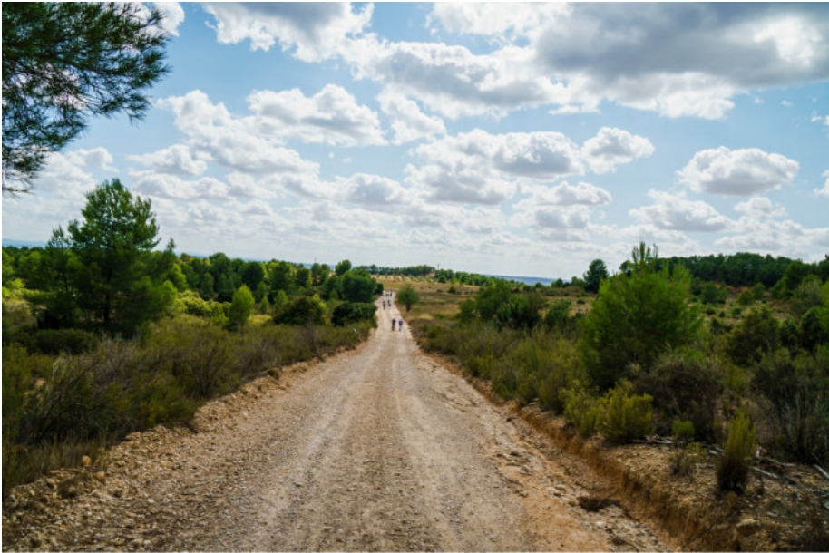
Rundwanderung Hoces de Cabriel