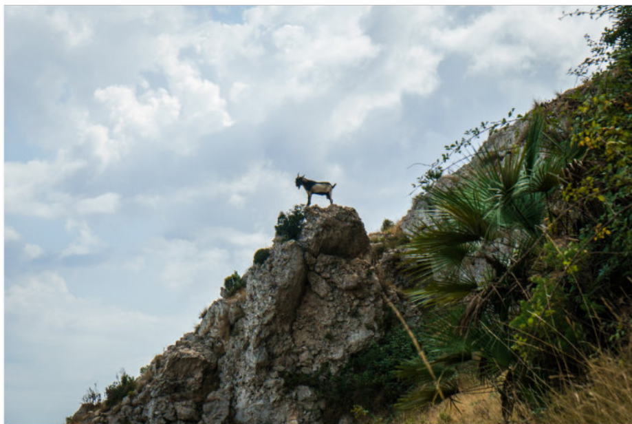
Umrundung des Serra de Bérnia