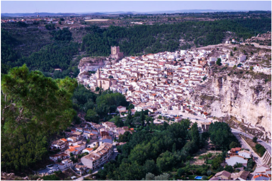
Alcalá del Júcar