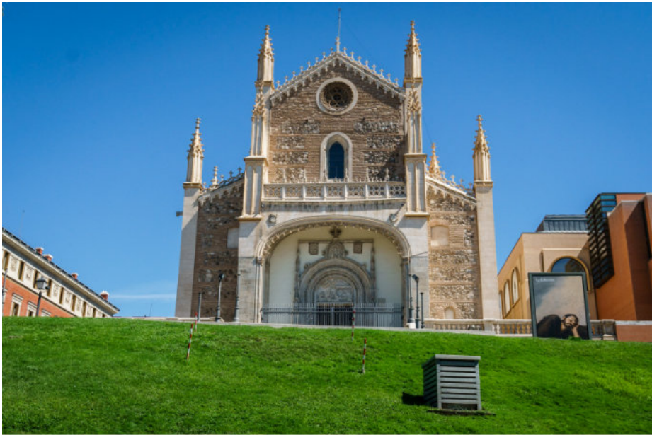
Beim Museo Nacional del Prado