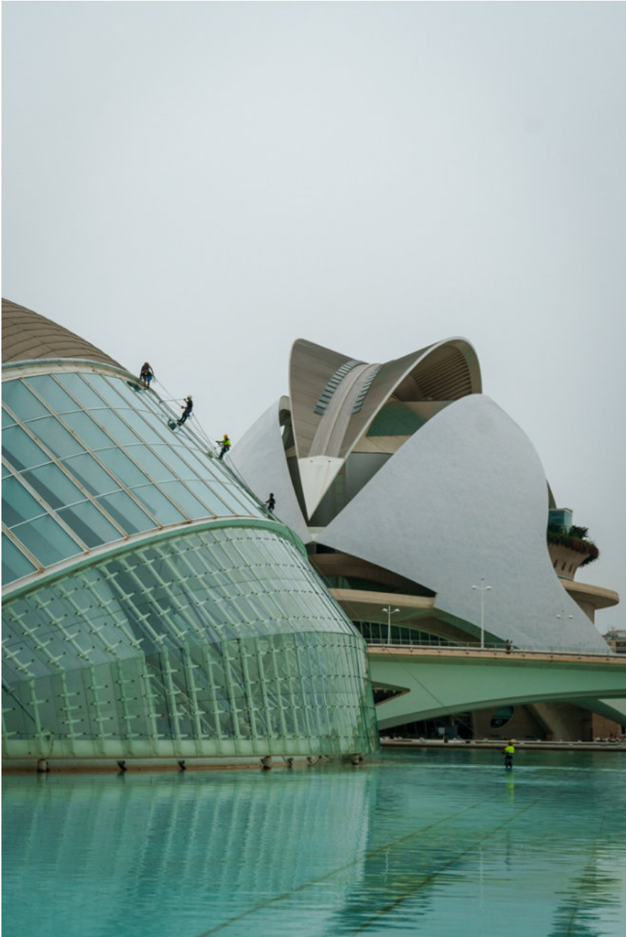
Im Vordergrund El Hemisféric