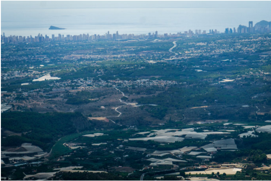
Im Vordergrund Plástico, im Hintergrund Benidorm