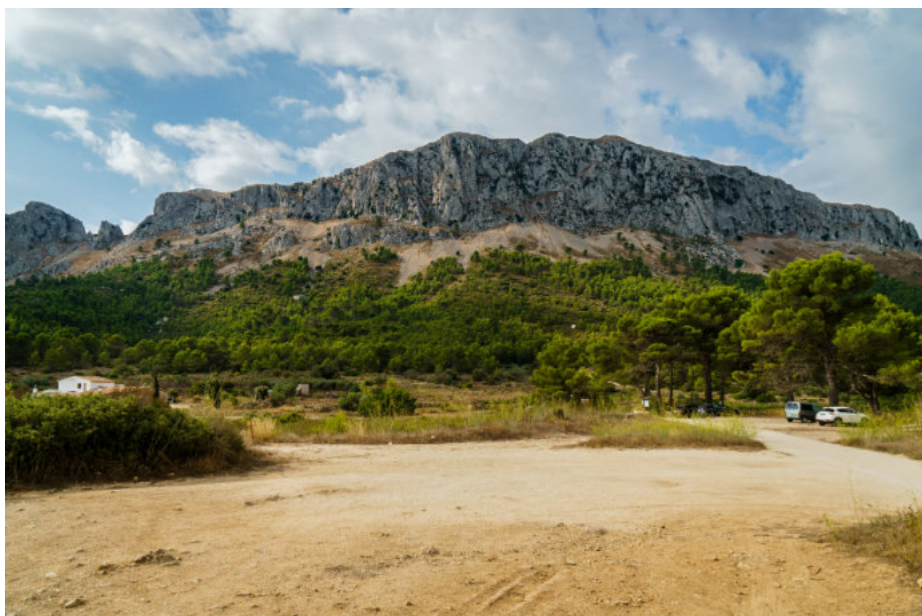
Serra de Bérnia