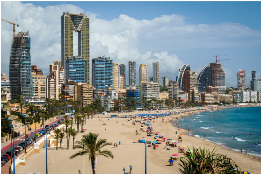
Wanderung von Villajoyosa nach Benidorm