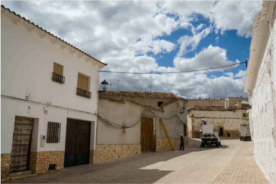
El Toboso: Der Ort wo in der Vorstellung von Don Quijote seine Geliebte Dulcinea lebte