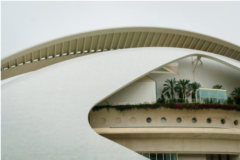
Palau de les Arts Reina Sofia