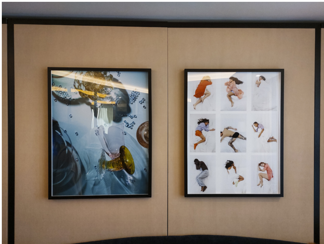
Standardzimmer im Haupthaus