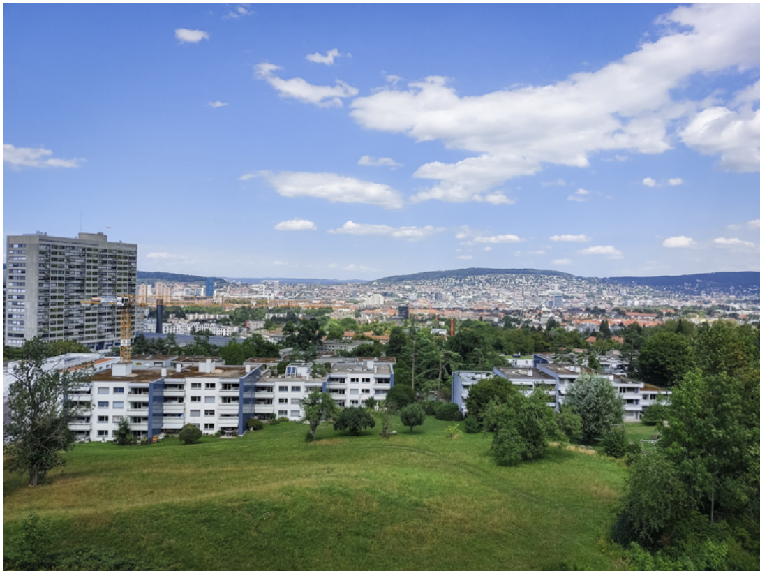
Aussicht auf die Stadt