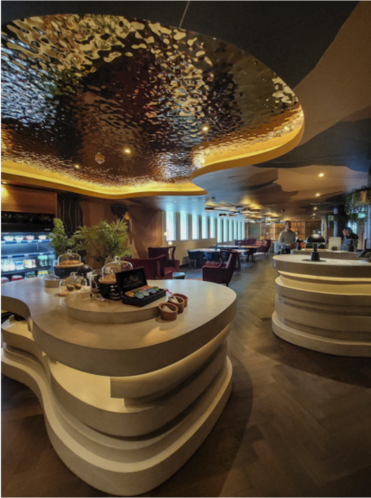
Lobby im Ostflügel