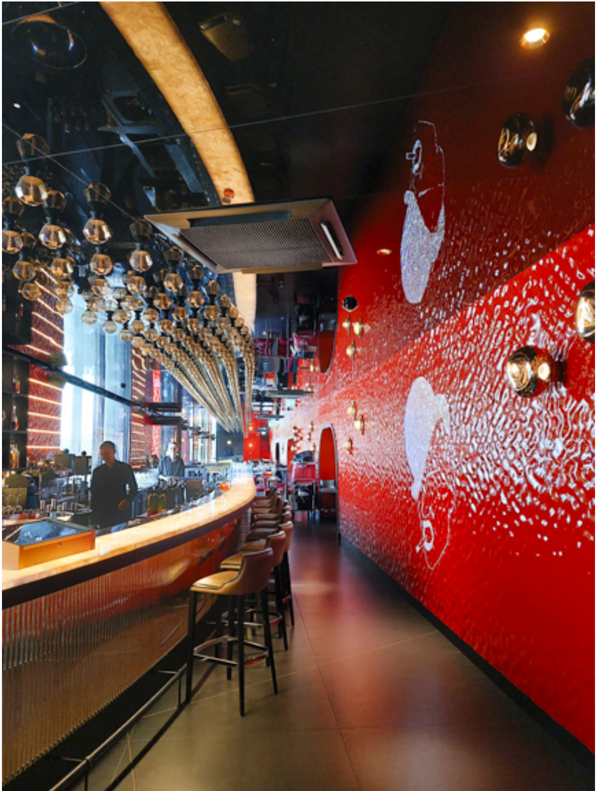
Das Penthouse in der obersten Etage ist die ursprüngliche Wohnung des Emir von Katar