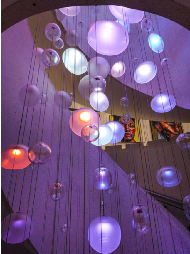
Die denkmalgeschützte Wendeltreppe mit der Lichtinstallation