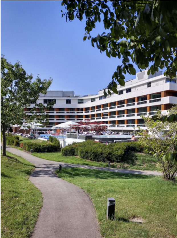
Das Gebäude von Süden (Pool-Seite)...