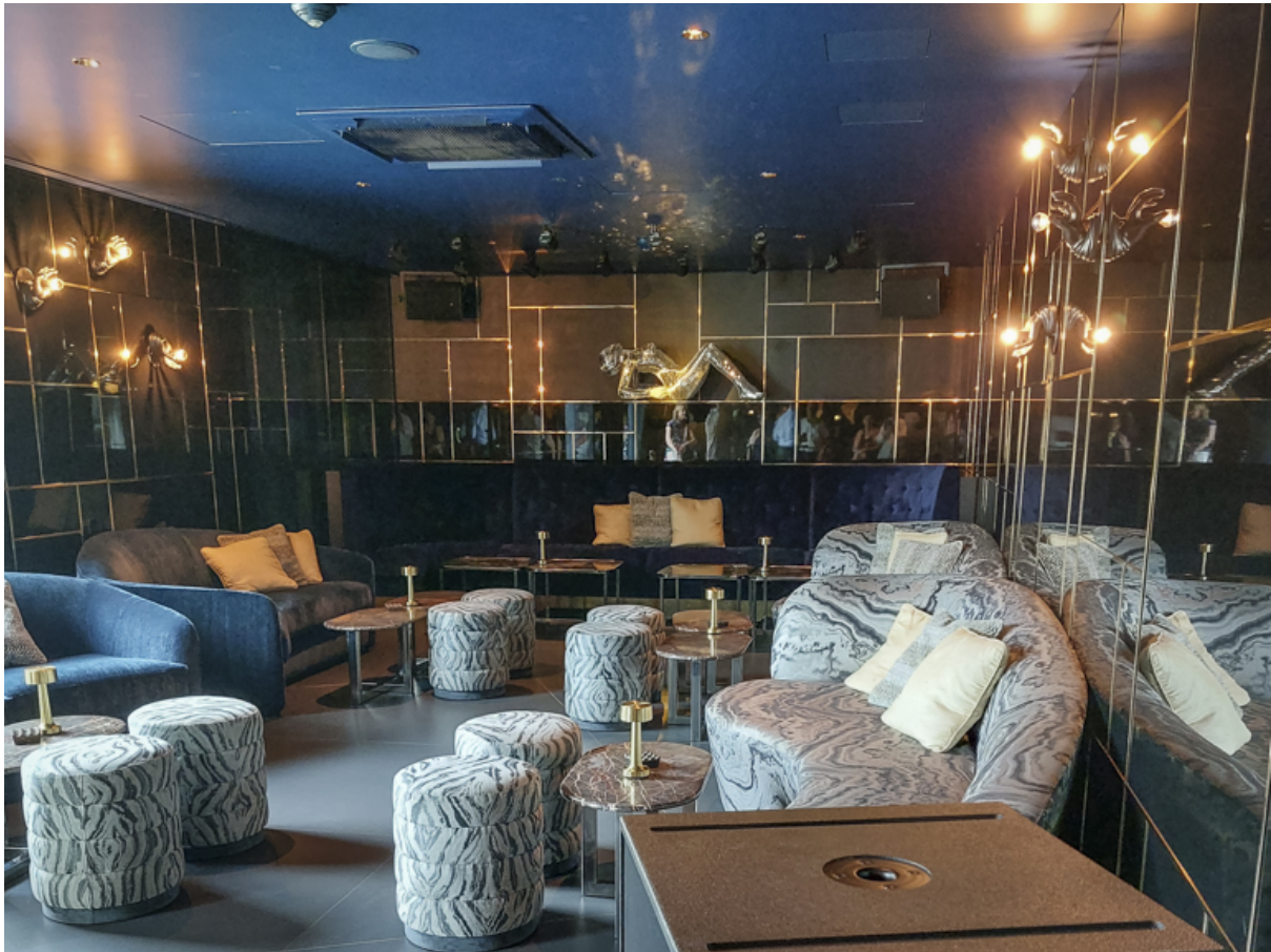
Raucherecke (Shisha-Bar). Hier wird nur der beste hausgemachte Tabak serviert. Ab CHF80