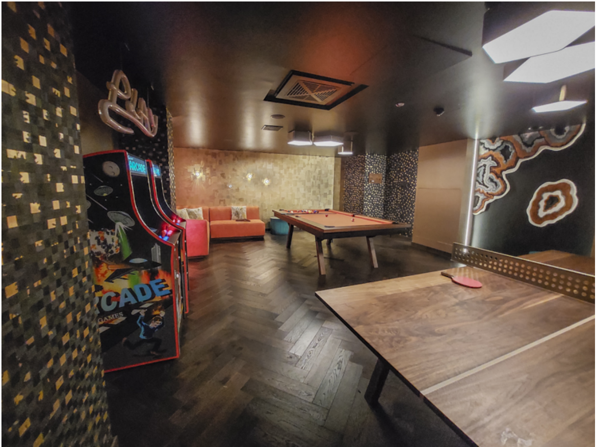
Spielzimmer im Luftschutzraum