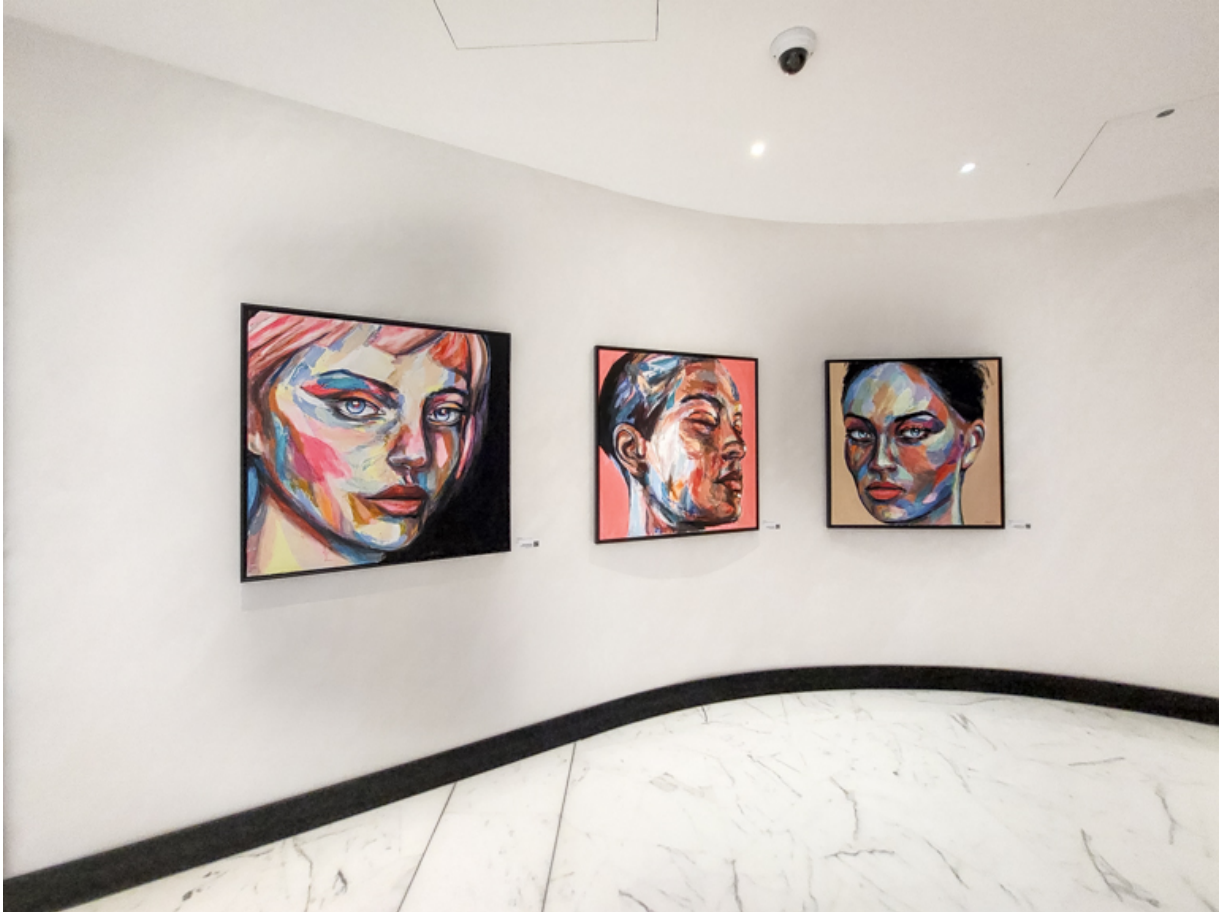
Die Korridore, Treppenhäuser und Zimmer sind mit Werken von einheimischen KünstlerInnen ausgestattet