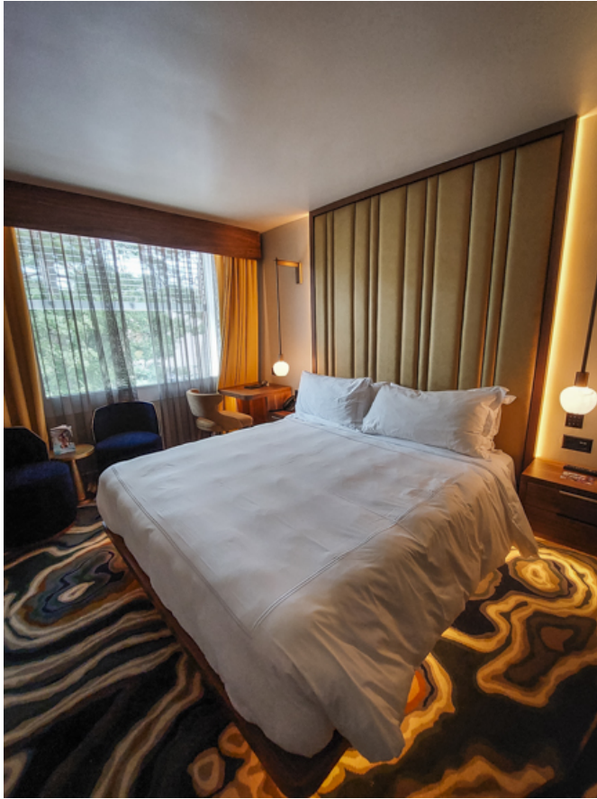
Bescheideneres Zimmer im East Wing