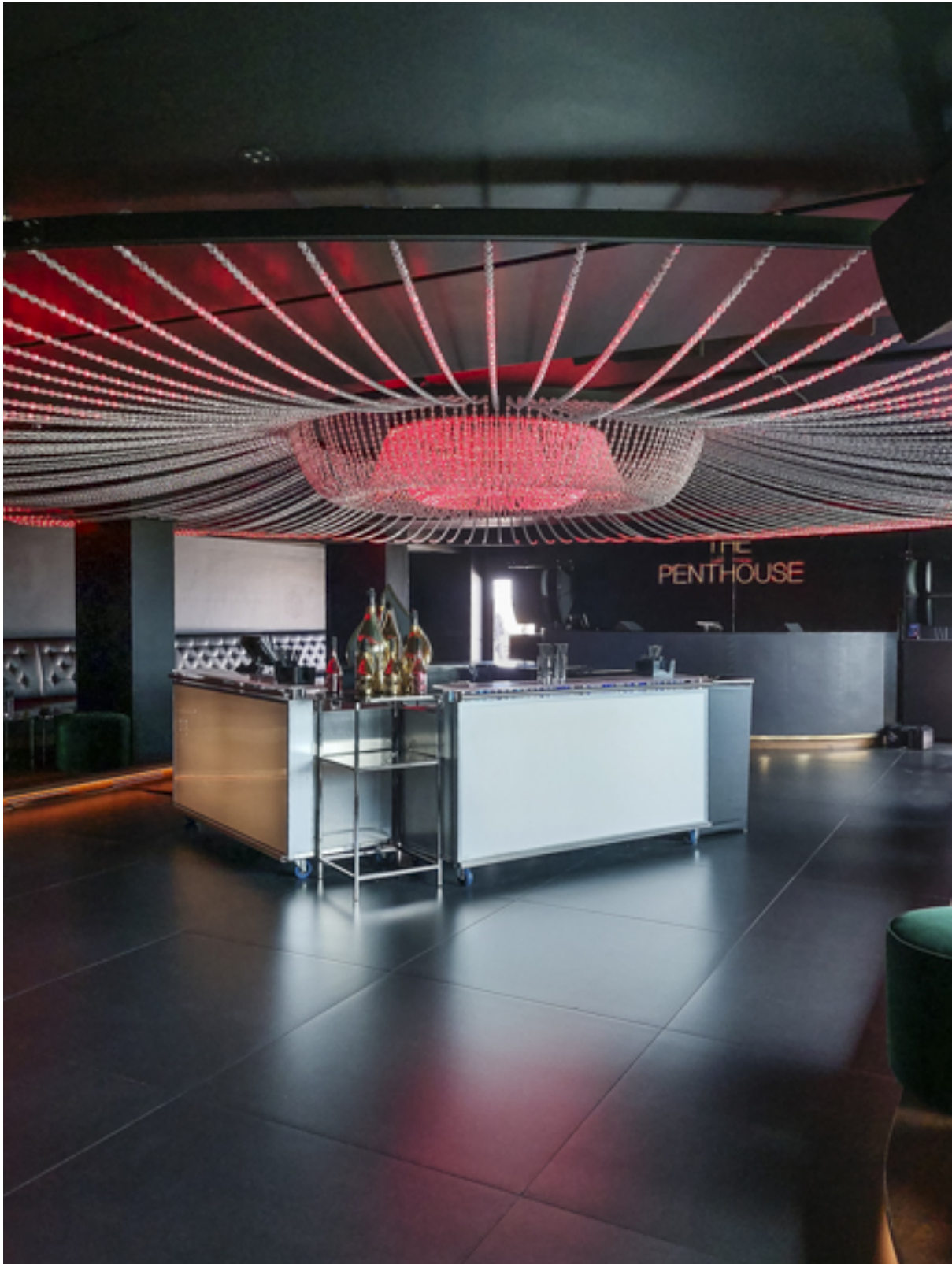
Die Tanzfläche des Clubs mit der verschiebbaren Bar. Hier legen weltbekannte Techno-Künstler und Djs auf.