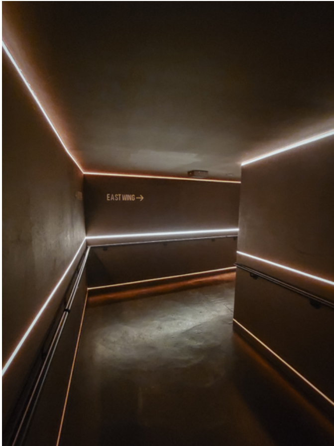
Durchgang zum Nebengebäude (Ostflügel)