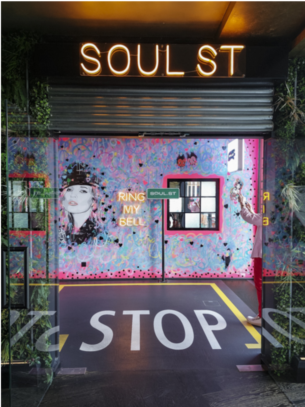
Zur Soul Street, wo es Street Food gibt. Fun Dining im Gegensatz zu Fine Dining in den anderen Restaurants