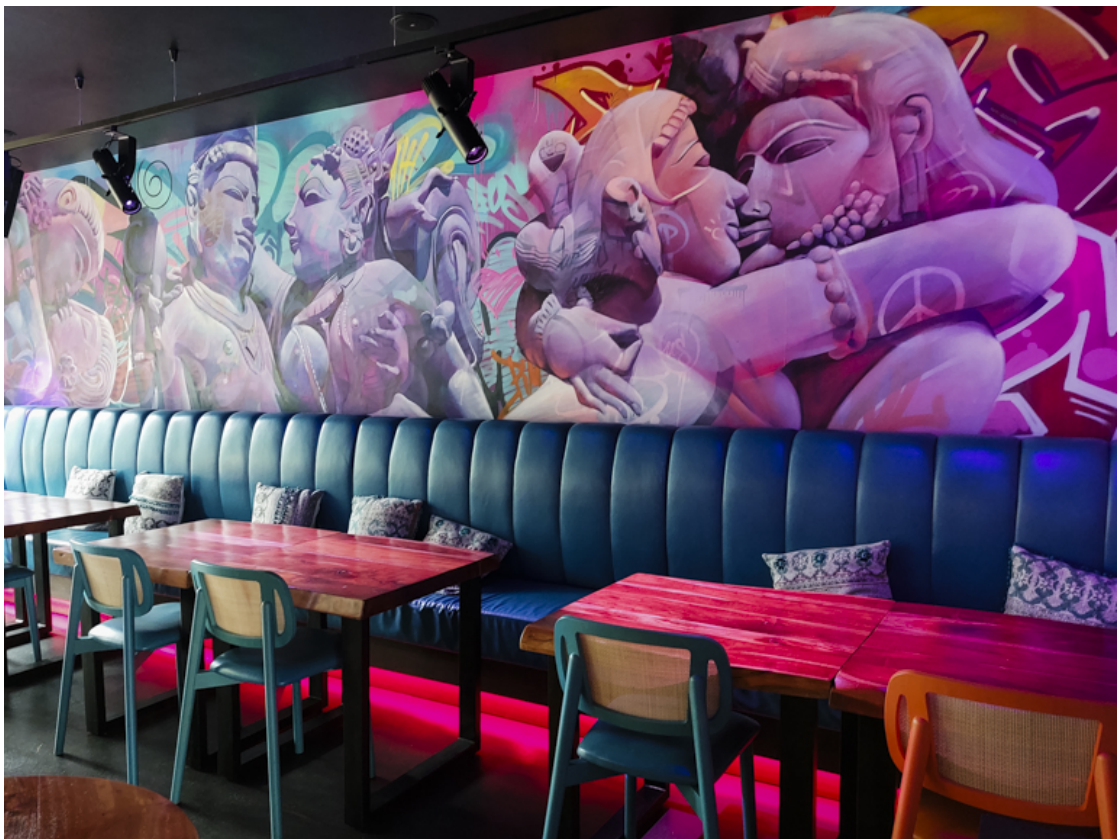
Hier wird verschiedenes Street Food serviert