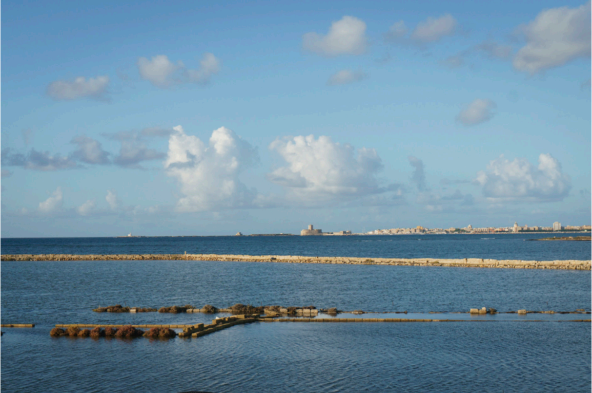
Besuch der Salinen von Trapani. Sie gelten als Naturreservat und werden vom WWF verwaltet