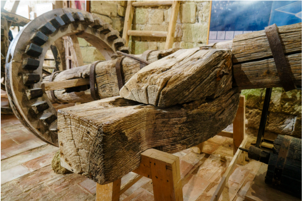
Getriebe einer Windmühle