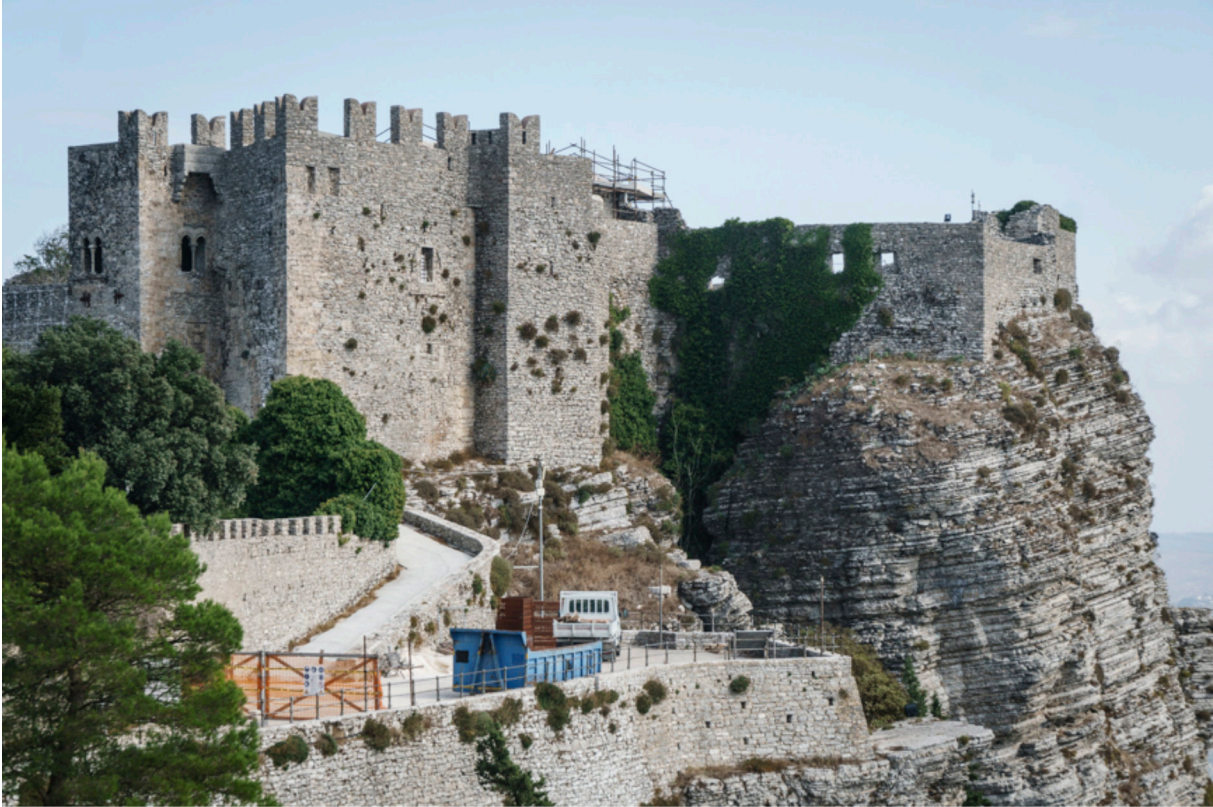
Castello di Venere