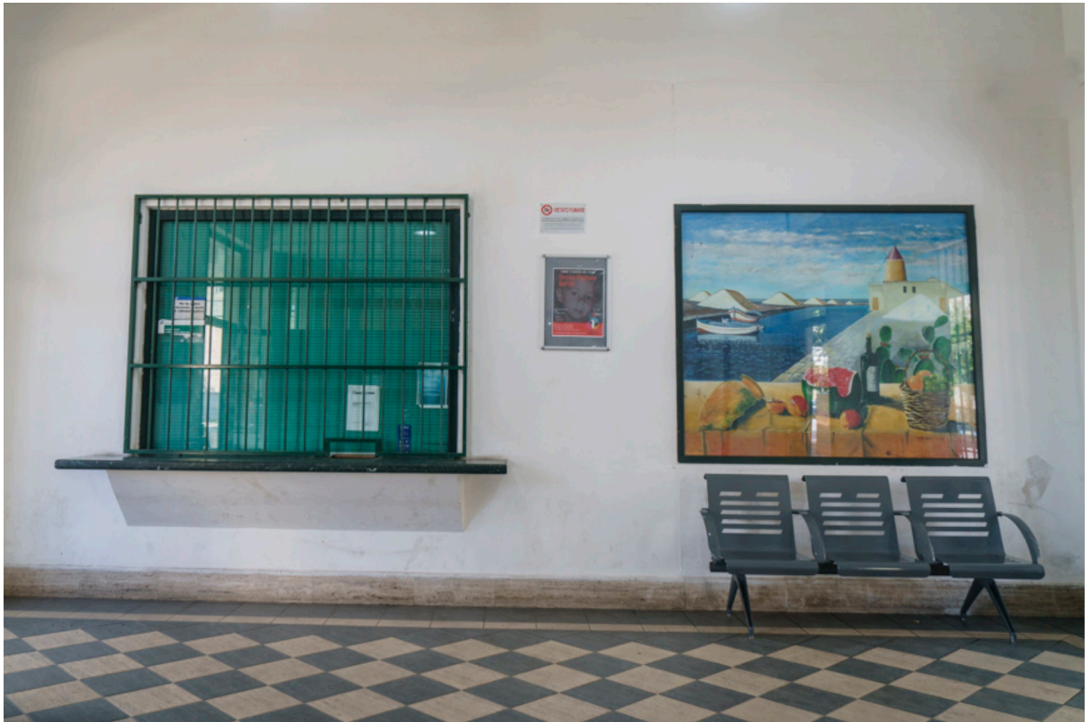
Mit dem Zug nach Marsala: Bahnhofshalle