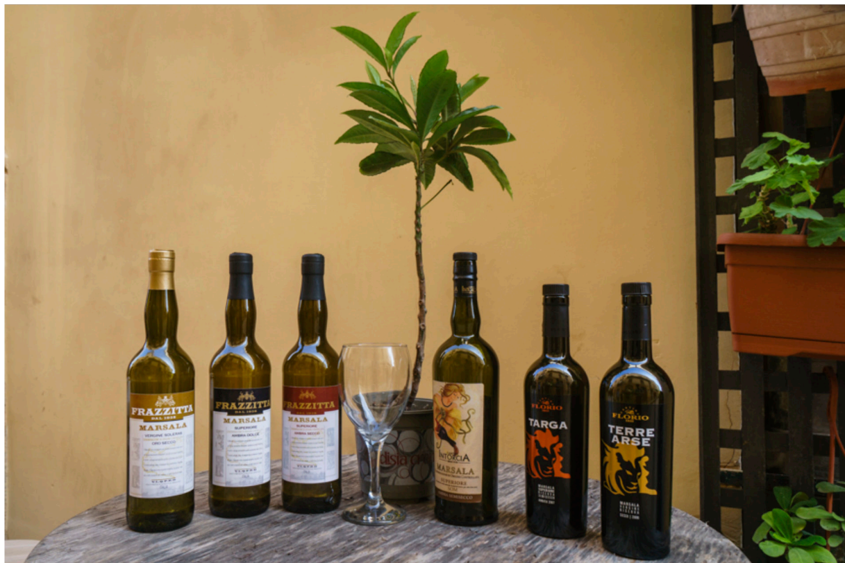
Die Stadt Marsala ist berühmt für seinen Dessertwein