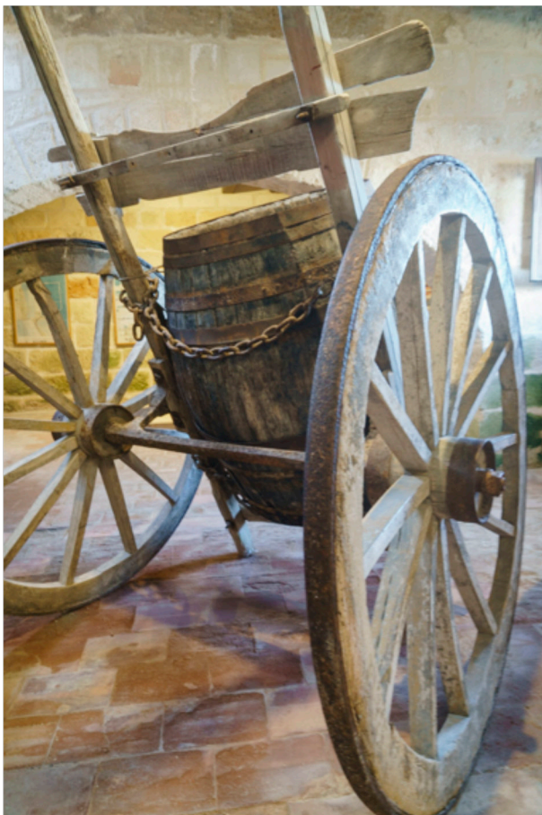
Aus diesem Fass wurden die Salzarbeiter mit Tranksame beliefert