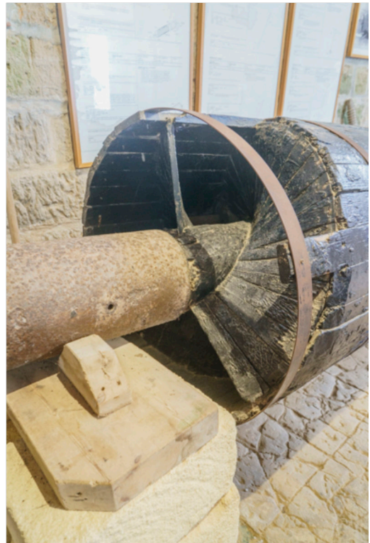
Archimedische Pumpe aus Holz

Die Windmühlen wurden nicht nur zum Mahlen des Salzes sondern auch zum Pumpen der Salzlake von einem Becken zum anderen verwendet.