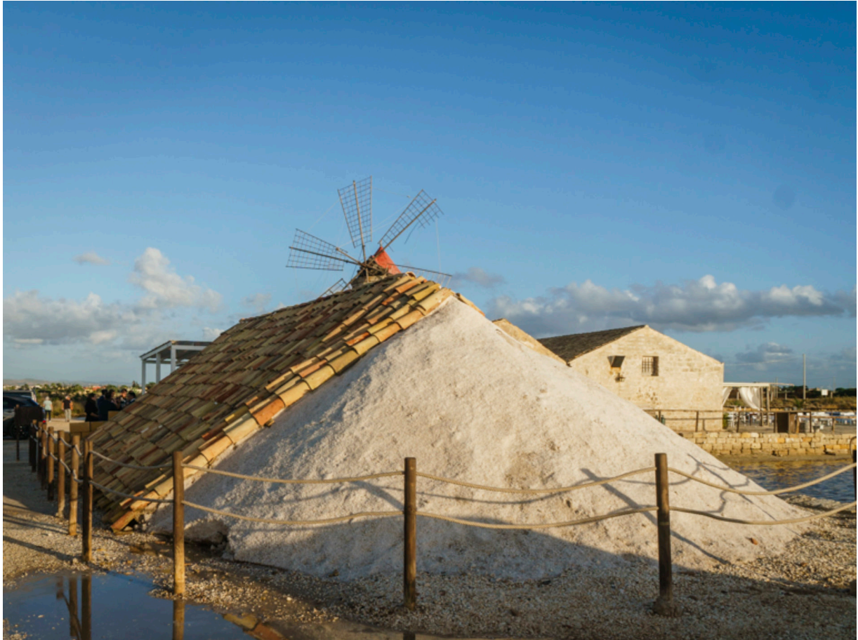
Das gewonnene Salz wird aufgeschichtet und mit Tonziegeln belegt