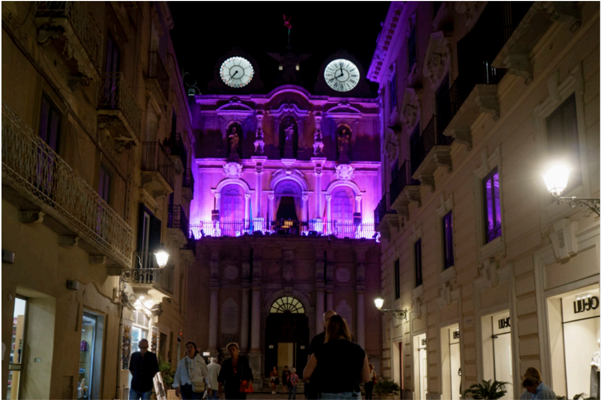
Uhrenturm in Trápani