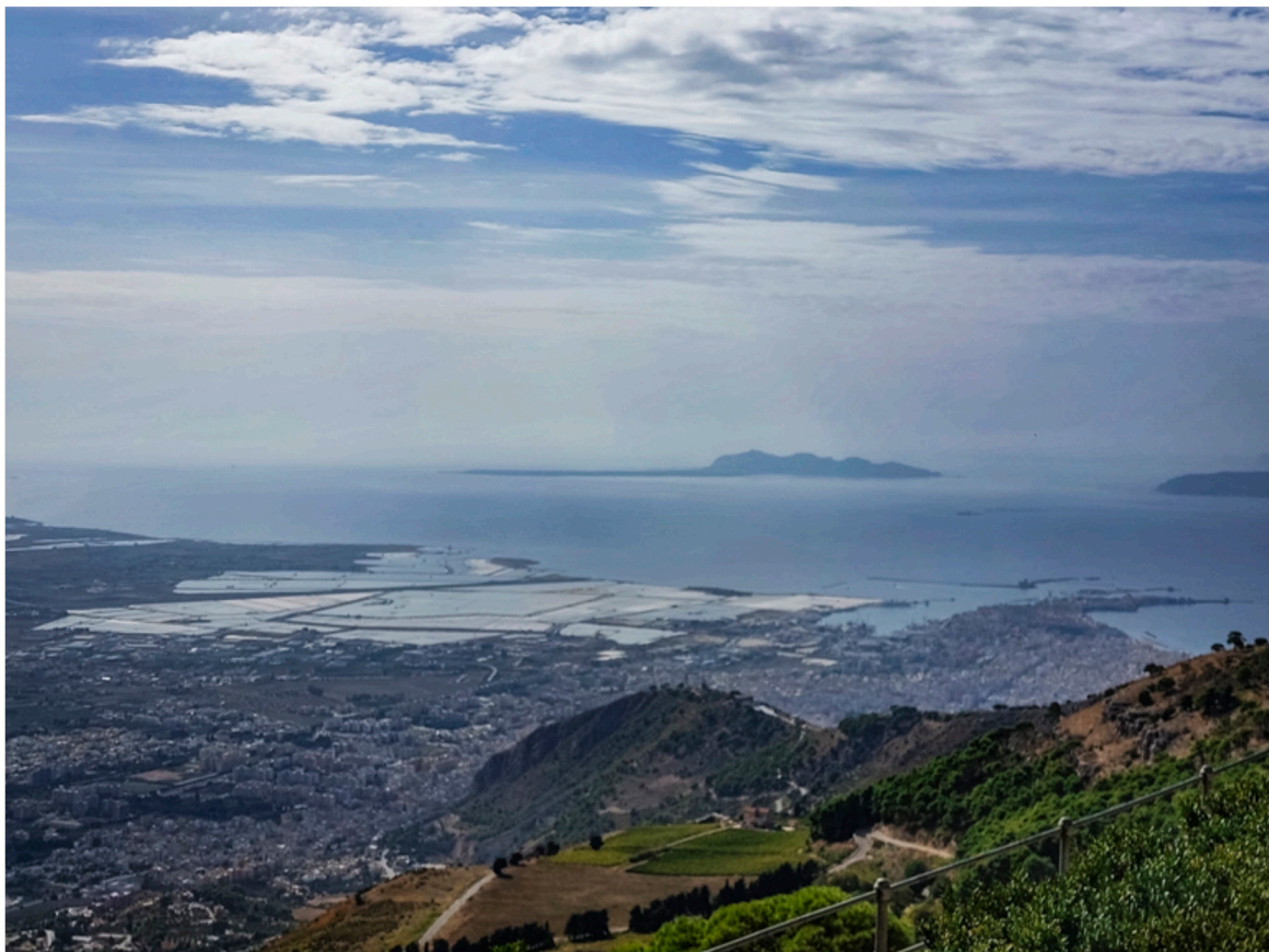
Die Salinen von Trápaní