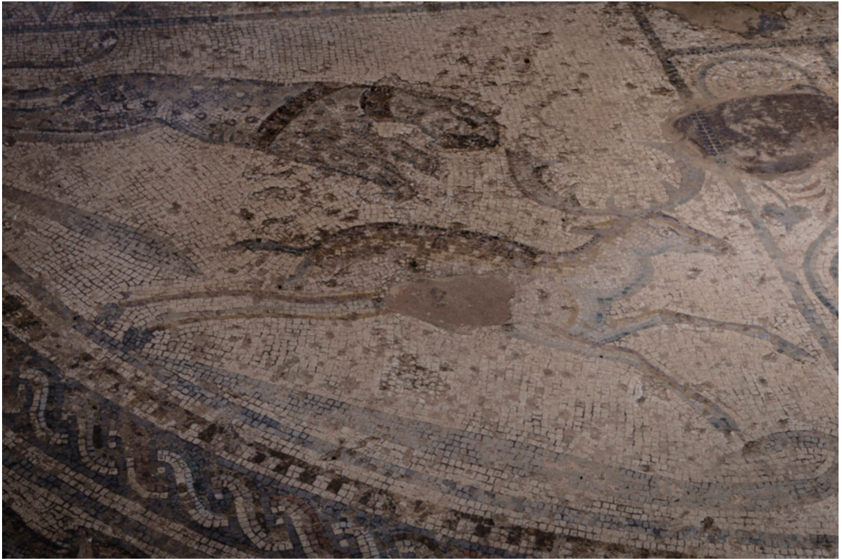
Bodenmosaiken in der ehemaligen römischen Therme