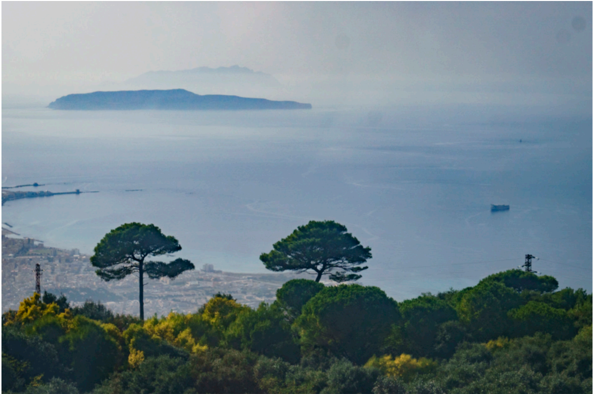
Abstecher mit der Seilbahn nach der Bergstadt Érice. Im Hintergrund die Ägadischen Inseln.