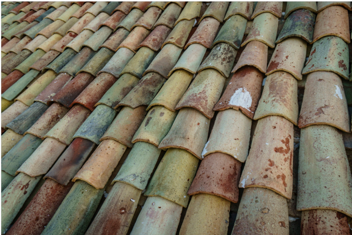
Die Tonziegel werden auf dem Oberschenkel des Arbeiters modelliert. Sie sind darum unregelmässig geformt