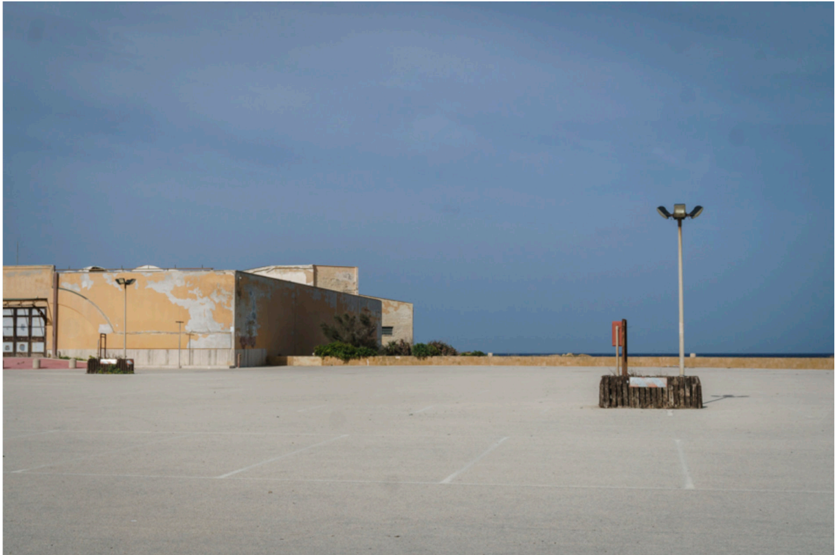
Parkplatz des Grossverteilers CONAD