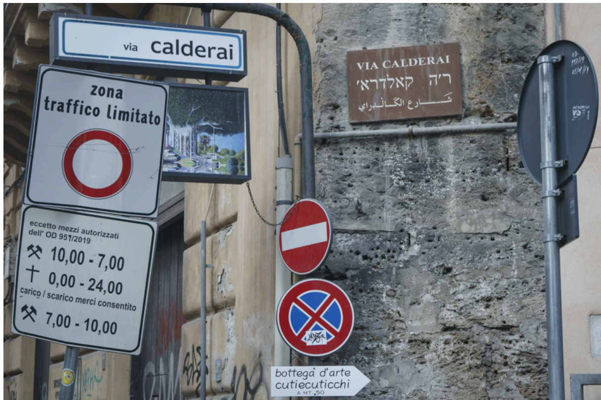
Man sieht den arabischen Einfluss bis heute