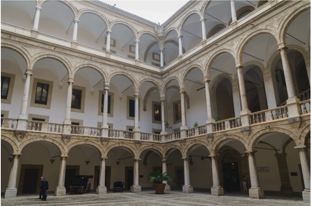
Ein weiterer Höhepunkt Palermos ist der Königspalast