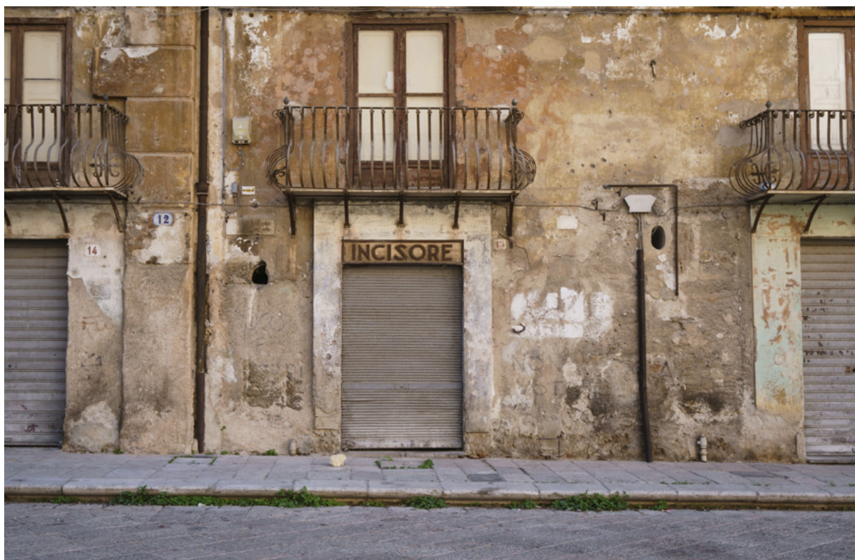
Im Quartier La Kalsa: Hier hatte mal ein Graveur sein Geschäft