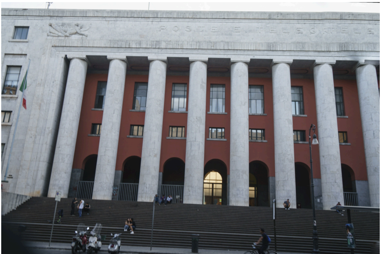
Die Hauptpost: Brutalo-Architektur aus der faschistischen Vorkriegszeit