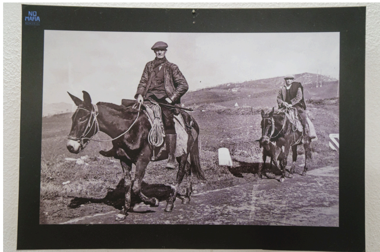
Karges Leben auf dem Land. Viele Bauern lebten als Tagelöhner praktisch ohne Rechte.