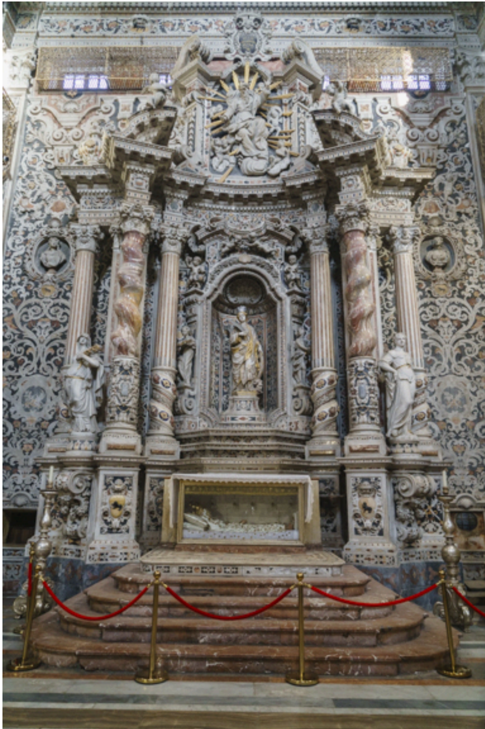
Überwältigende barocke Pracht aus Marmor in der Chiesa del Gesù