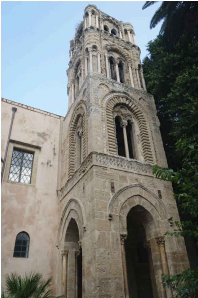
La Martadona aus dem 12. Jahrhundert