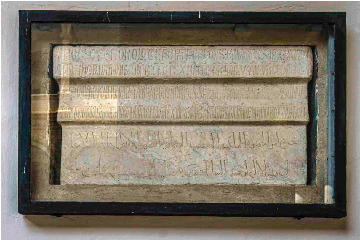
Stein mit Inschriften in römischer, griechischer und arabische Schrift