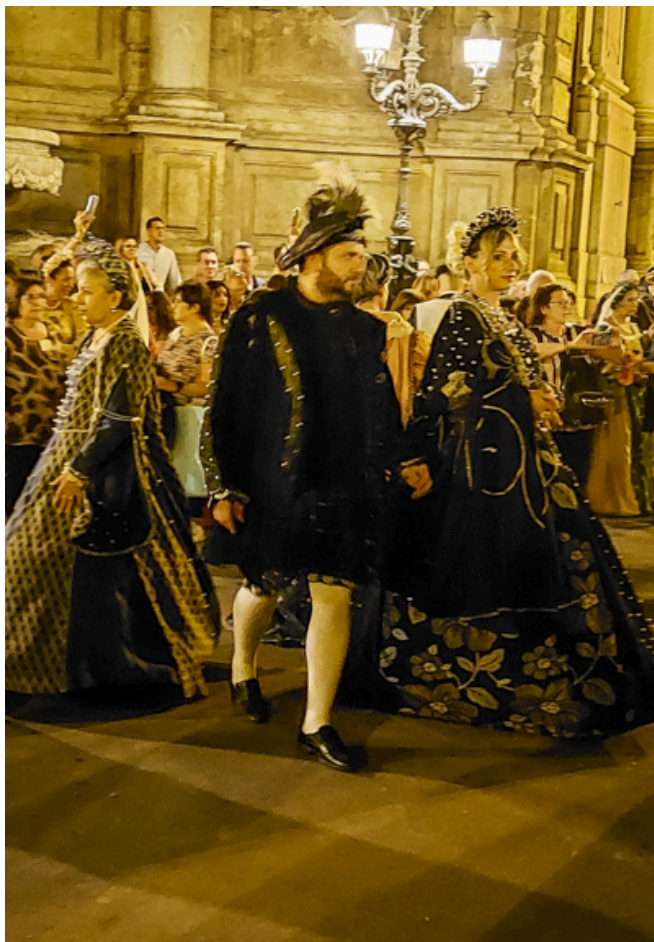
Aufführung auf dem Platz Quattro Canti