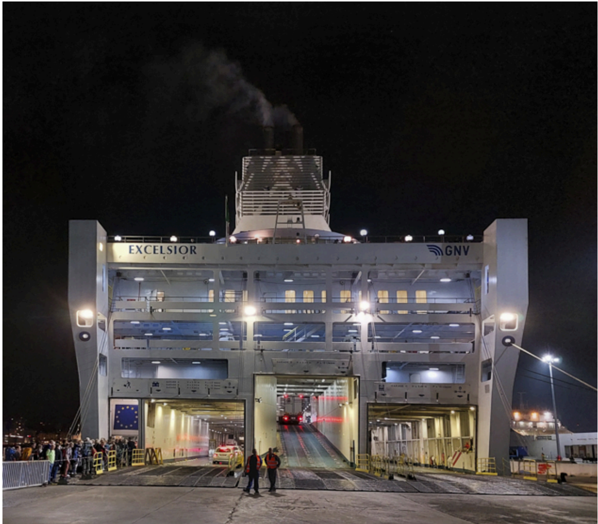
Mit dem Zug nach Genua und dann mit der Fähre nach Palermo