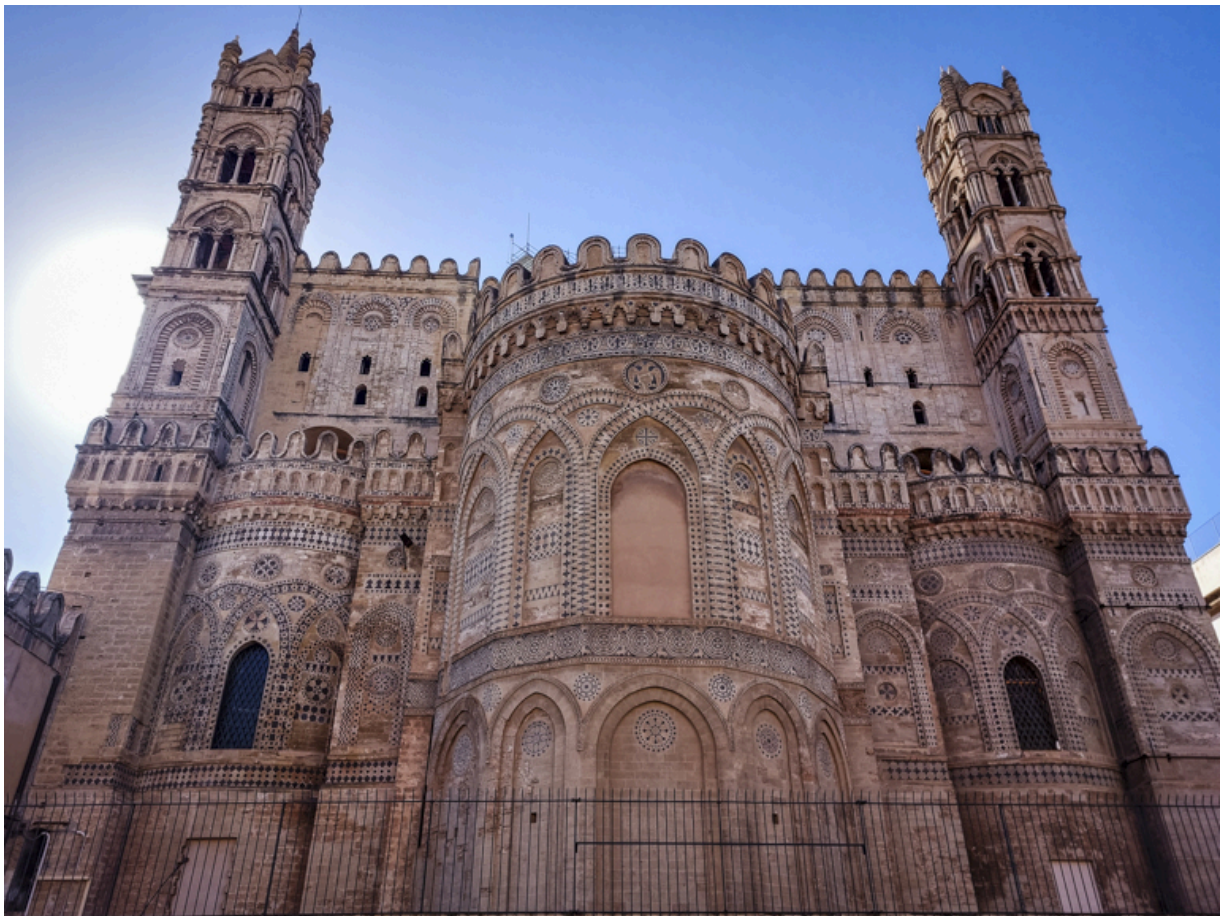
...aber auf der Hinterseite