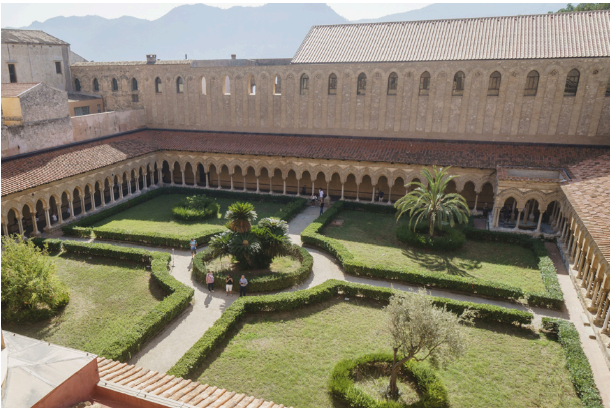
Der Kreuzgang des ehemaligen Klosters ist nicht weniger prachtvoll.