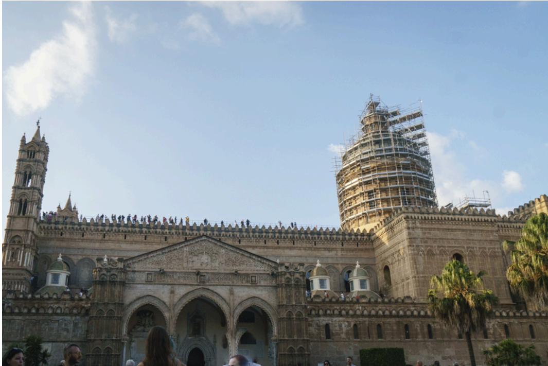
Der Dom von Palermo sieht von der Seite nicht so spektakulär aus,...