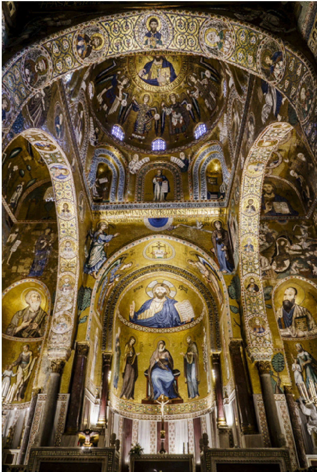
Im Königspalast befindet sich die Cappella Palatina aus dem 12 Jh. Die mit Mosaiken ausgekleidete Privatkapelle der Könige ist von atemberaubender Schönheit.