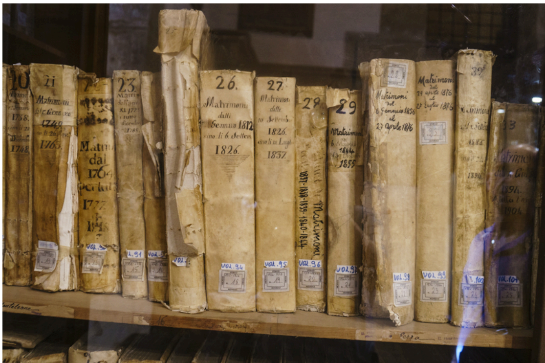
Im Kloster sind auch die Dokumente über Eheschliessungen vor Jahrhunderten aufbewahrt.