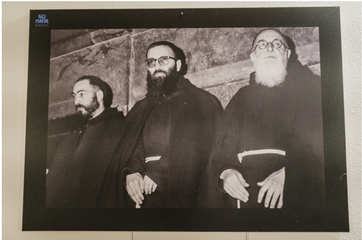
Dazumal waren auch Geistliche in die Mafia verwickelt