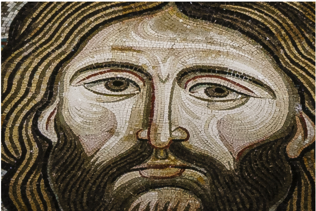
Sogar das Gesicht von Jesus wurde mit Mosaiksteinen modelliert.