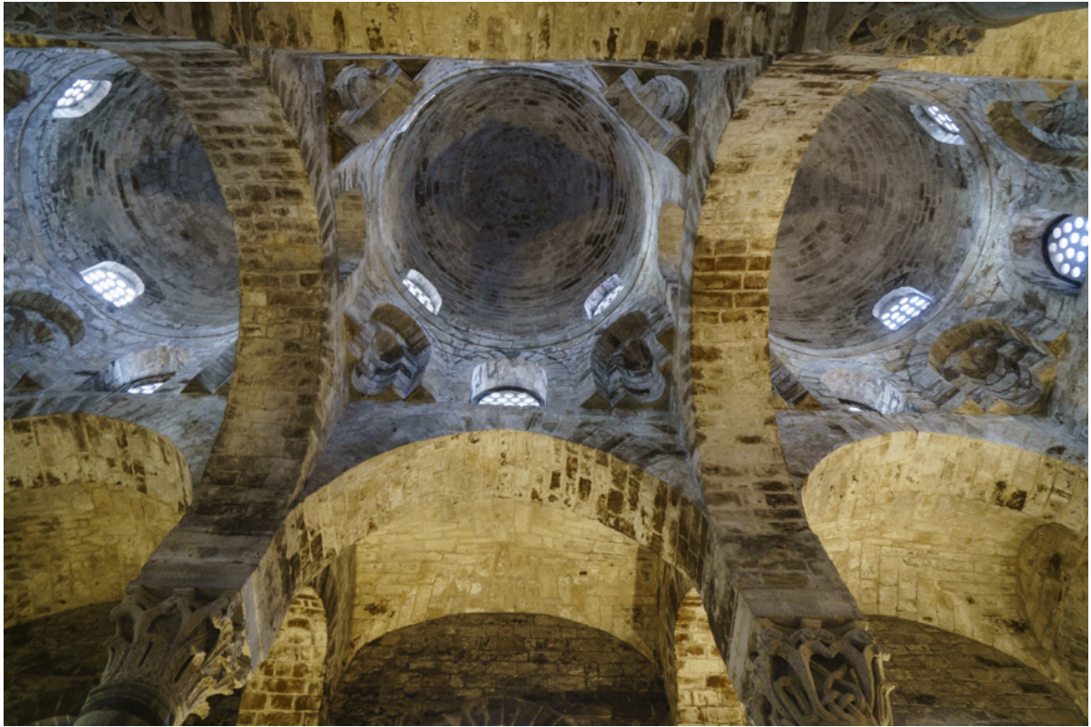
Keinerlei Schnörkel an der Kirche San Cataldo, die von arabischen Baumeistern gebaut wurde