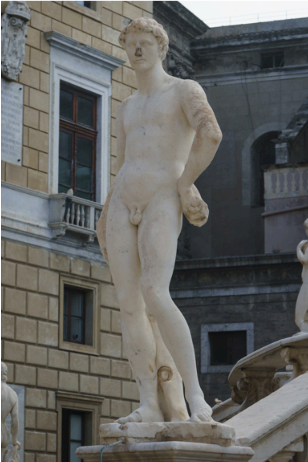
Platz der Schande. Es wird die Geschichte erzählt, dass die keuschen Nonnen des gegenüberliegenden Klosters in einer Nacht den Figuren dieses Brunnens die Penisse abgeschlagen hätten.