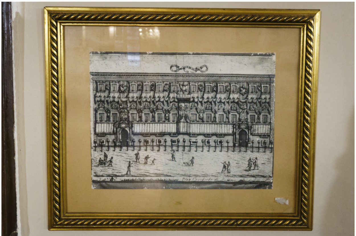
So sah der Palast früher aus.