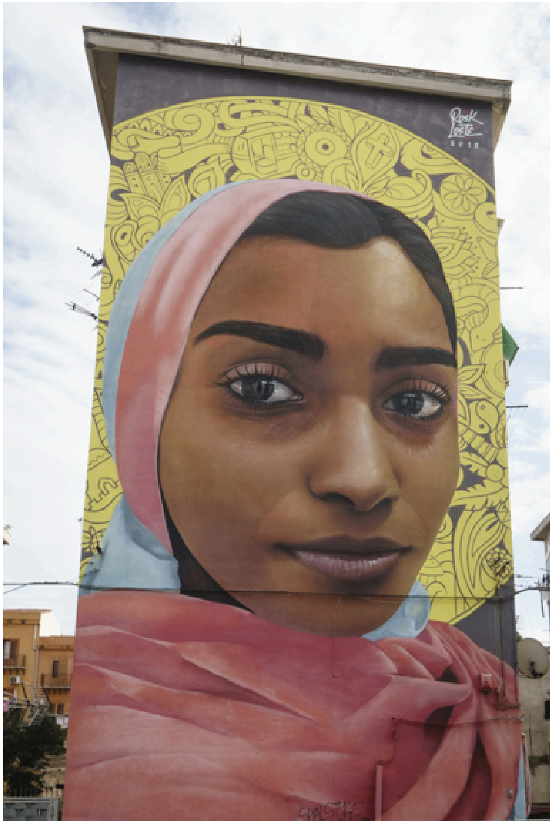
Ein Kunstwerk anderer Art: Wandmalerei im Quartier La Kalsa