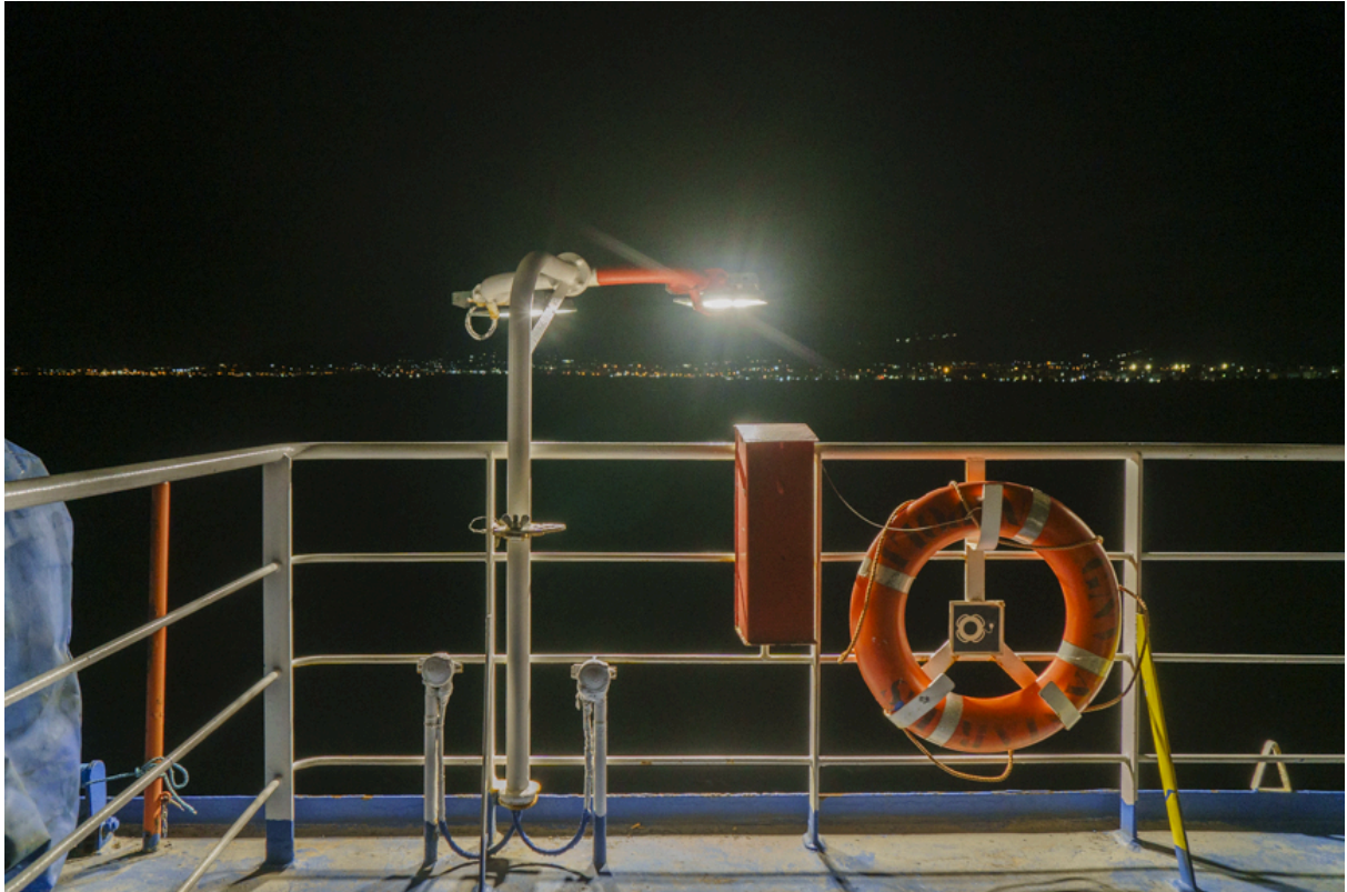
Fähre nach Neapel