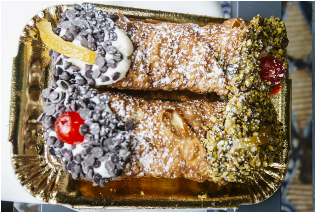
Typische Süßspeise Palermos sind die Cannoli. Eine knusprige Hülle gefüllt mit Ricotta und Zutaten