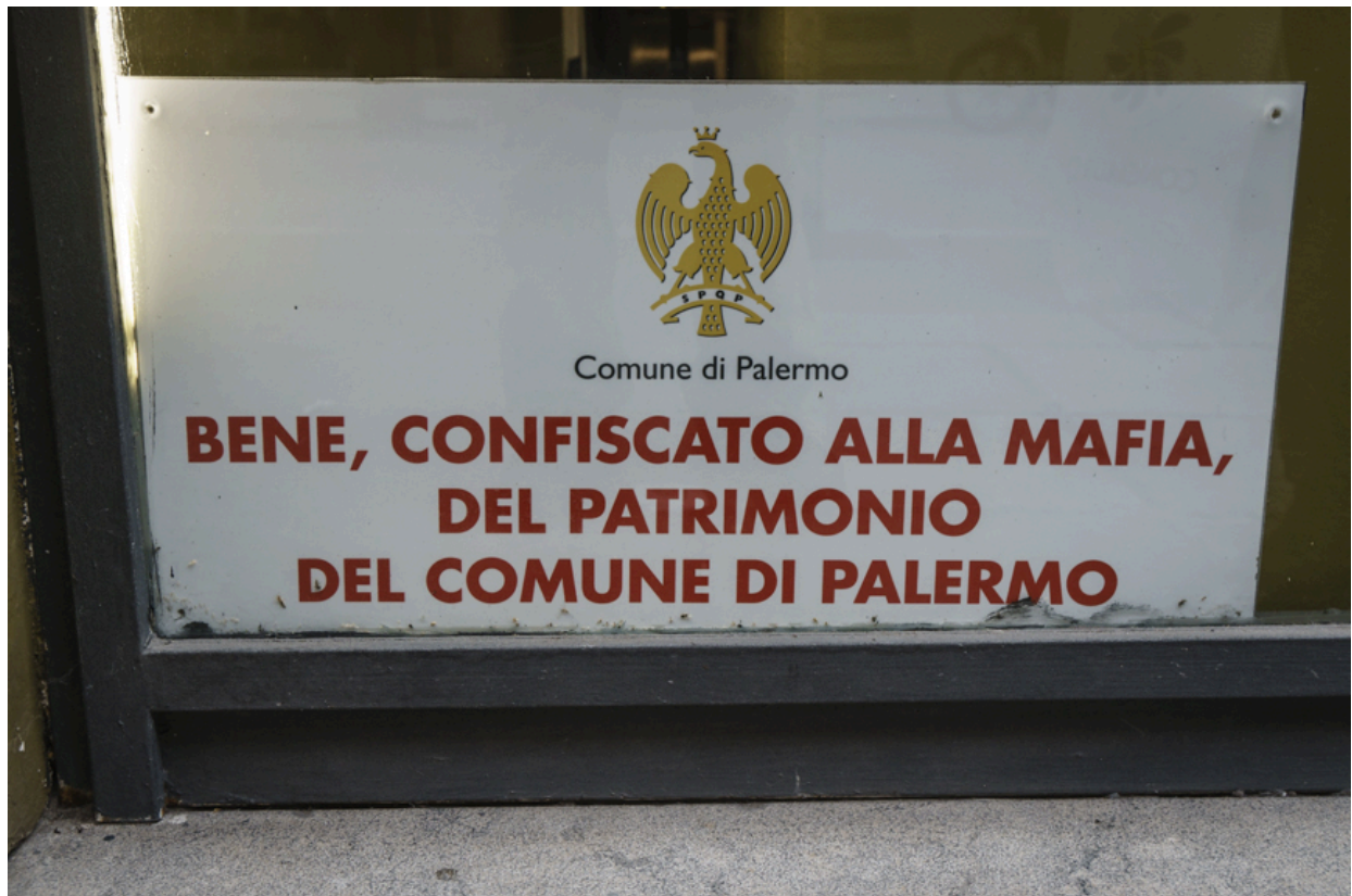
Die Mafia ist auch heute noch aktuell. Dieses Ladengeschäft wurde aus den Händen der Mafia befreit.