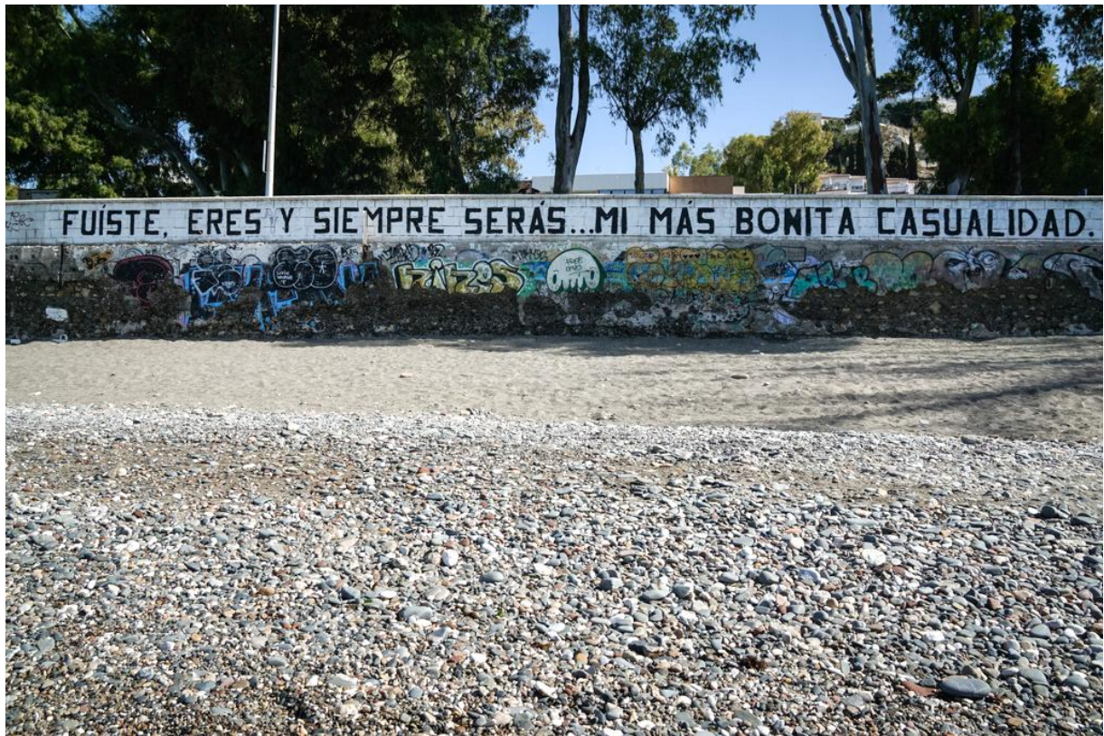
Du warst, bist und wirst immer sein...mein schönster Zufall