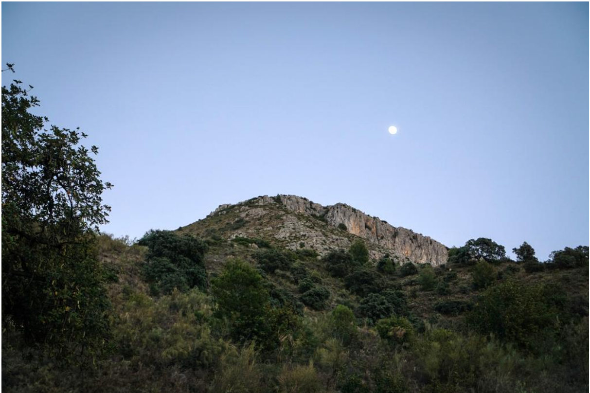
Unser Hausberg, der San Antón