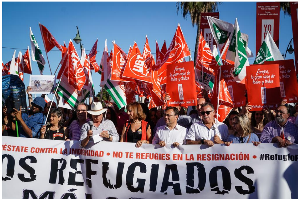
Demo für die Syrienflüchtlinge