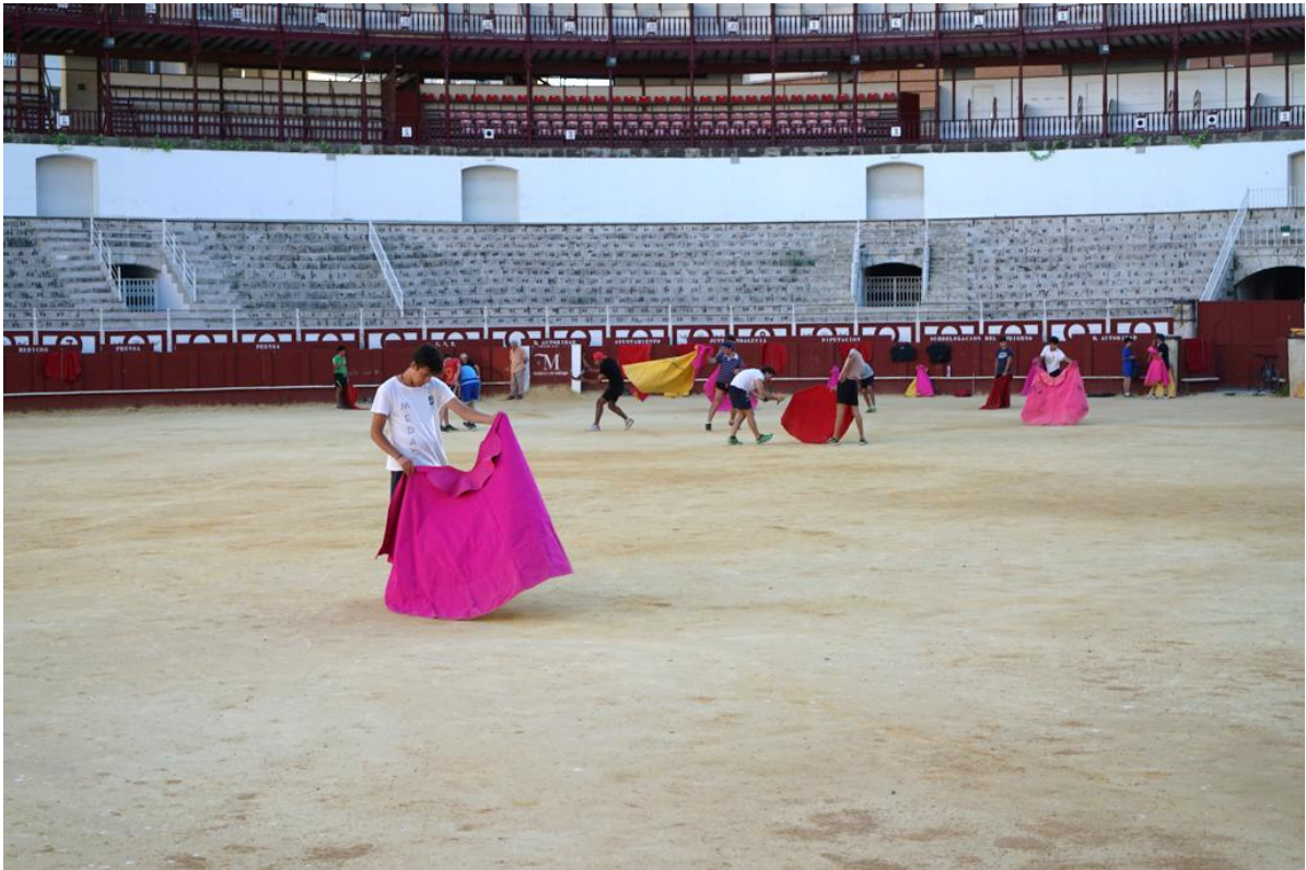
Angehende Matadore beim Üben