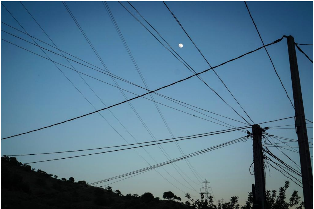
Im Dorf, La Mosca