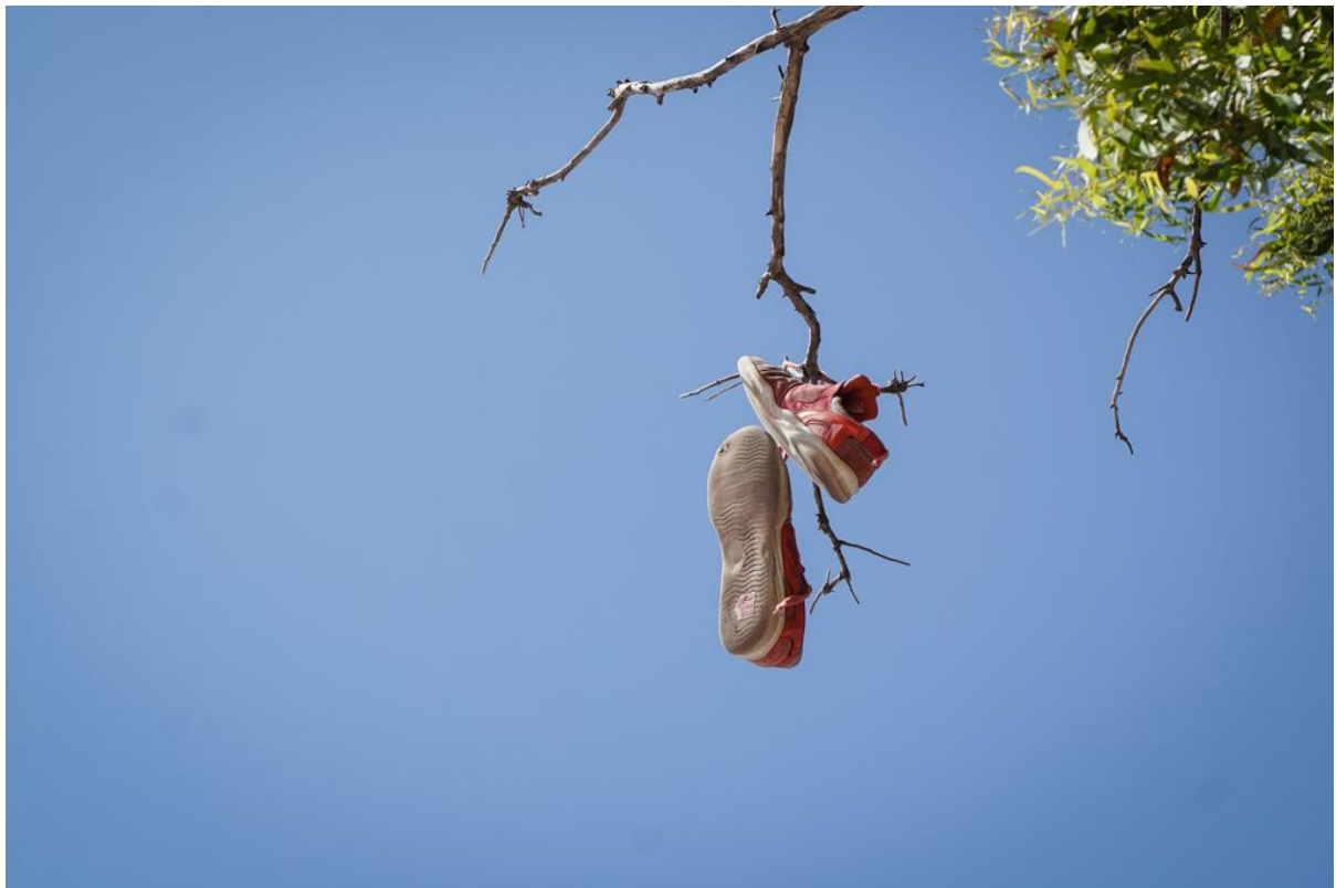
In El Palo