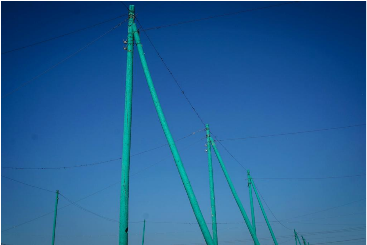
Auf dem Flohmarktgelände